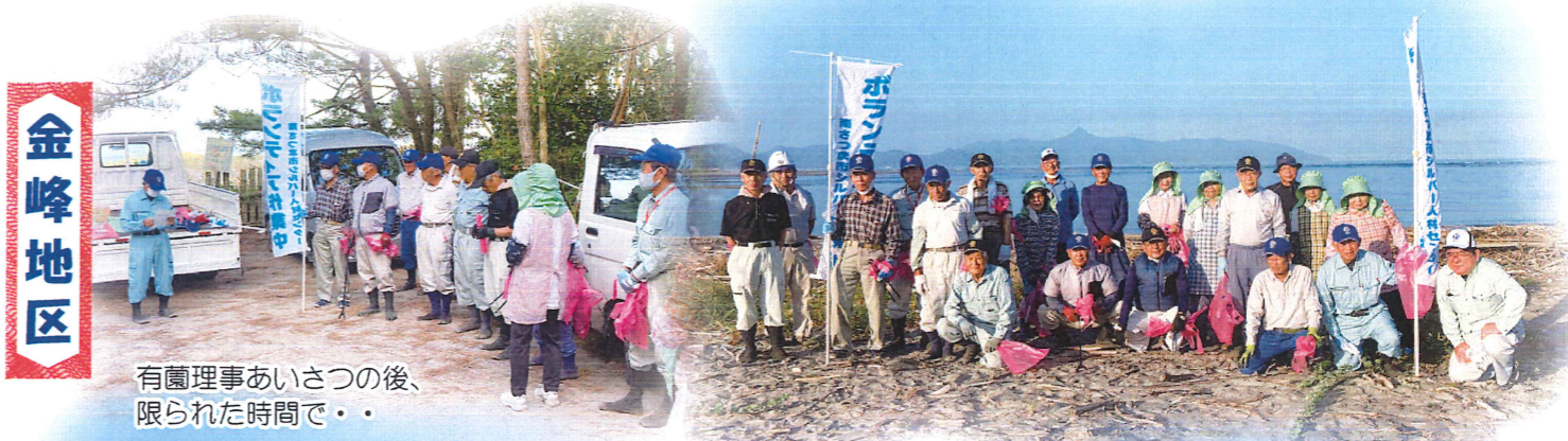
有園理事あいさつの後、限られた時間で・・・