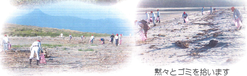
黙々とゴミを拾います